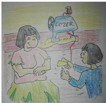
Fernanda en casa corriendo donde su mamá con los pases al aire, agitándolos mientras le habla con emoción a sus mamá de su participación en el taller