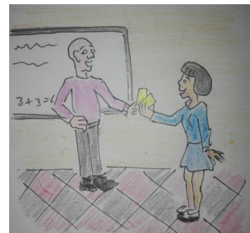
Al final de las clases en sala de profesores le dan un pase y otro extra para un acompañante.