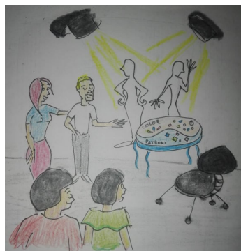
Sofía presentándole a Ángel, que la llevo a un salón grande con luces, muebles, un computar y unos maniqués. Indicándole que se sentara.